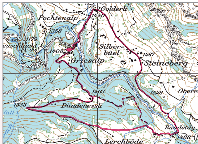
--- Trail: Griesalp - Golderli - Bundstäg - Griesalp

Achtung! Die Griesalp befindet sich in einem Lawinen gefährdeten Gebiet. Die Gefahrensituation ist daher zu berücksichtigen. Die Schneeschuhroute kann kurzfristig geschlossen werden!